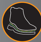
Plantilla de armado en Kevlar Antiperforante